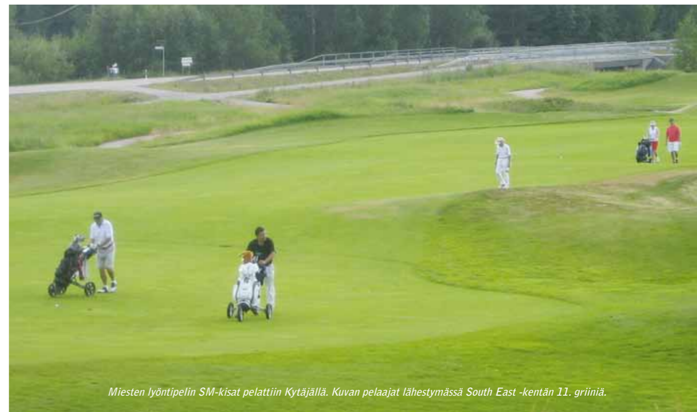
Miesten lyöntipelin SM-kisat pelattiin Kytäjällä. Kuvan pelaajat lähestymässä South East -kentän 11. griiniä.