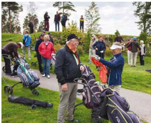
Peuramaan seniorien päätöksisa ja -tapahtuma keräsi runsaasti osanottajia.