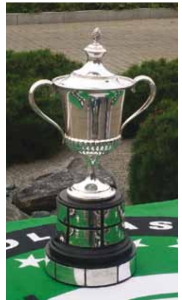
Komea pokaali meni näinä vuonna Ranskan joukkueelle

Lopullinen sijoituksemme oli siis 11. Tällä kertaa pystyimme pitämään lyöntipelien jälkeisen sijoituksemme. Voiton ja EM-kultaa vei Ranska, jonka voittoon tarvittiin nelinpelin 19. reikä. Hopeaa sai Englanti ja pronssia Irlanti, joka voitti lyöntipelien jälkeen johdossa olleen Saksa.