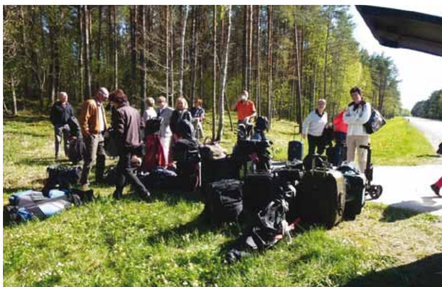
Tältä näyttää kun joukko Peuramaan senioreita purkaa matkatavansa stopin tehneestä bussista jossakin Kuussaaren ja Kuivastun välissä Saarenmaalla.