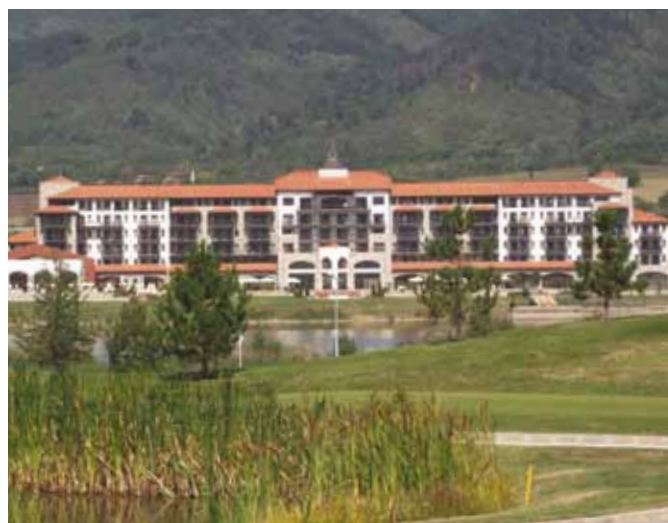
Paravetsin komea hotelli väylältä 16 katsottuna.

Toisena pelipäivänä emme onnistuneet aivan yhtä hyvin kuin ensimmäisenä ja jäimme sijalle 10. Saksan ollessa 9. sijalla samalla lyöntimäärällä. Olimme neljän lyönnin päässä ykkösryhmästä, eli kahdeksannesta sijasta. Jäimme siis kamppailemaan sijoista 9-16 kuten edellisenäkin vuonna.