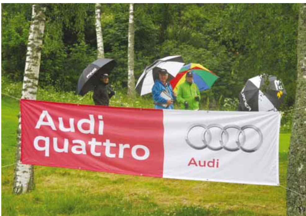
Kulunut kesä oli kaksijakoinen, alkukesänä vallitseva säämuoto oli kuvan kaltainen ja vasta elokuussa saatiin nauttia auringosta, jopa helteestä. Kuva Espoon Golfseurassa heinäkuun 17.-18. päivänä pelatusta FST-kisasta