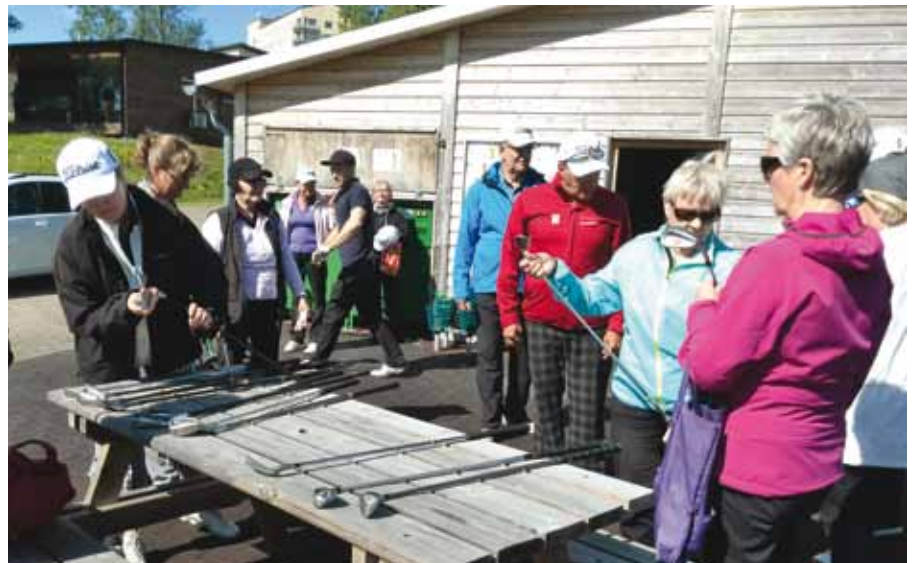
Viipurin Golfin jäsenet olivat luovuttaneet vanhoja varusteitaan golftulokkaiden käyttöön. Välinearsenaalista löytyi sopiva maila jokaiselle.