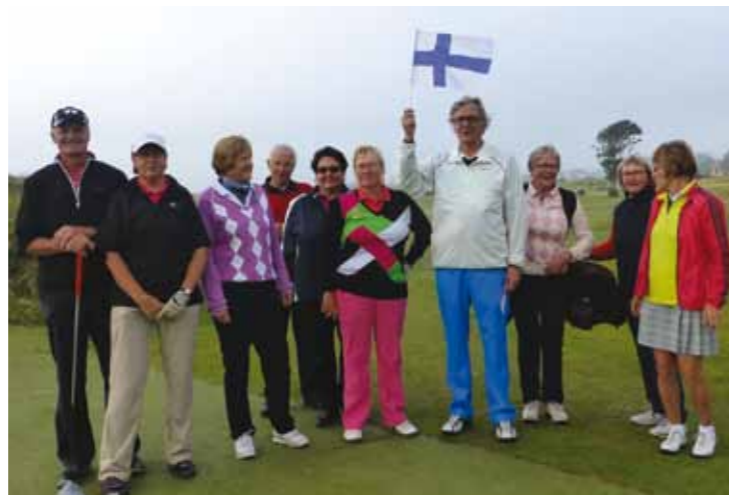
Porukka juhlavasti ykköstiillä matkanvetäjän johdolla.

Nyt pelin luonne muuttui täysin edellispäivästä. Olin luullut aikaisemmin