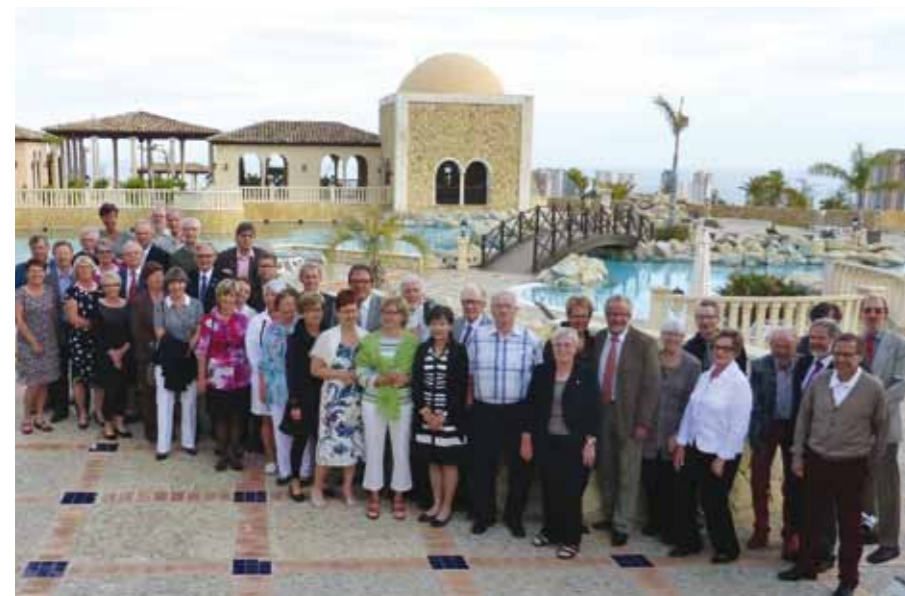
Ensimmäisellä viikon lopuksi kuvassa poseeraa 42 golfaria. 20 palasi Suomeen viikon jälkeen, tilalle saapui 22 pelaajaa.