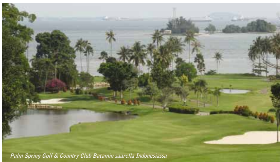
Palm Spring Golf & Country Club Batamin saarella Indonesiassa