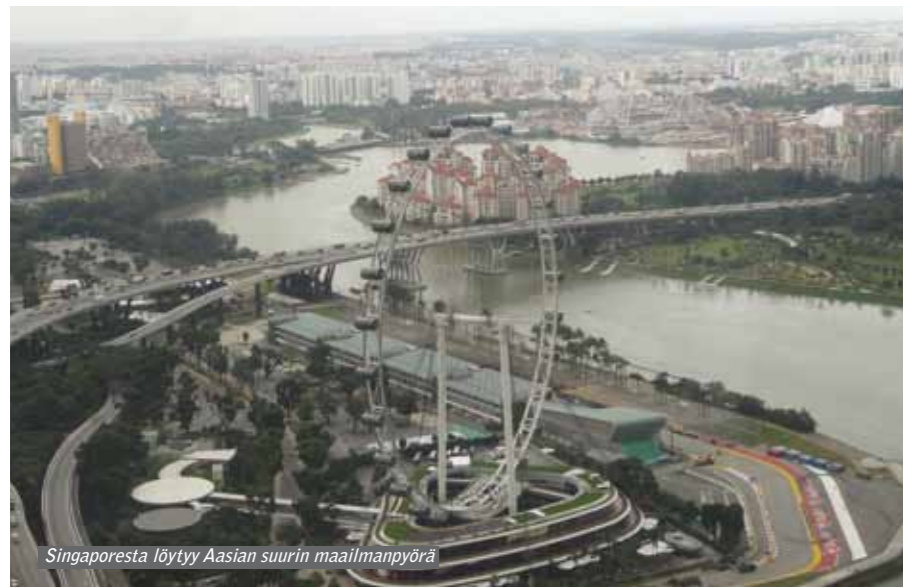
Singaporesta löytyy Aasian suurin maailmanpyörä

tikuksia oli kaatunut juurineen. Väyliä ei oltu ajettu pariin päivään, mutta viheriöt olivat liukkaat ja loogiset vaikka näyttivät vähän rupisilta.