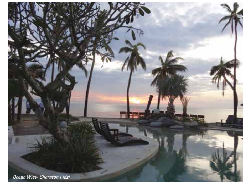
Ocean View Sheraton Fidzi

Seuraavana aamuna hotellin portierin tarjoutui viemään meidät Pokuen golf-