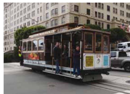
Mitä olisikaan San Francisco ilman raitiotievaunujaan?

Varasimme ajan TPC Harding Golf Clubilta ja ajoimme taksilla kentälle. Esitimme toivomuksen saada paikallista peliseuraa ja ykköstiille ilmestyikin kuusikymppinen rouva, joka osoittautui erinomaiseksi golfariksi ja klubin ensimmäiseksi naisjäseneksi. Tulimme hyvin juttuun ja hän vei meidät pelin jälkeen hotelliimme. TPC:n greenfee oli 120 € pelaajalta. San Franciscon alueella on useita mielenkiintoisen näköisiä golfkenttiä, joista osa on vain jäsenten käytössä. TPC