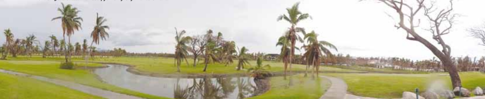
Pokuen golfkenttä Fidzissä pyörremyrskyn runtelemana

passimme takaisin. Greenfee, caddie, golf-auto, kuljetus kentälle ja edestakainen 45 min laivamatka maksoivat yhteensä murto-osan Singaporen golfkenttien greenfeestä.